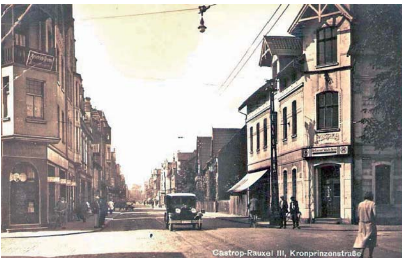
Lange Straße, ehemals Kronprinzenstraße, Foto privat 1925

Parken auf der Lange Str. inklusive der Ladeflächen ..... 30 Minuten in den Seitenstraßen bis ca. 50 Meter vor der Querstr. .... 3 Stunden dahinter ..... ohne zeitliche Begrenzung